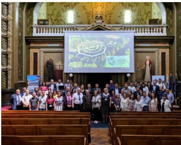
Foto nr. 3. Conferința Internațională „Present Environment and Sustainable Development (PESD)” , Iași, iunie 2019 (în Aula Universității Tehnice ”Gh. Asachi”)