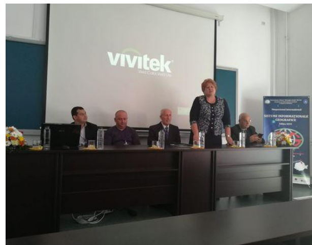
Foto nr. 4. Simpozionul Științific Internațional „Sisteme Informaționale Geografice” (SIG), Iași, secțiunea plen 2018