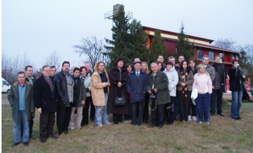
Foto nr. 5. Simpozionul Științific Internațional „Sisteme Informaționale Geografice (SIG)”, Cluj-Napoca, 2006 aplicație practică de teren pe Valea superioară a Someșului Mic