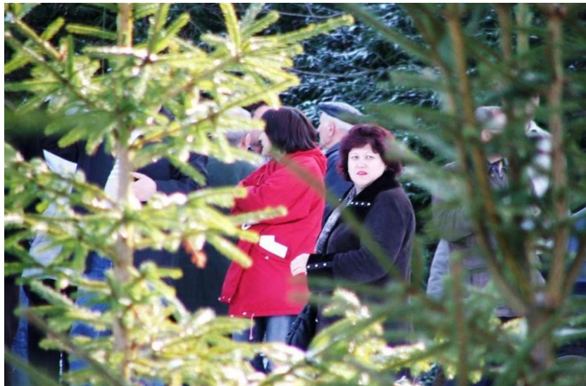
Foto nr. 6. Moment de reverie la Simpozionul Științific Internațional „Sisteme Informaționale Geografice (SIG)”, Cluj-Napoca, 2006

La un an de la trecerea în lumea celor dreți a Membrului corespondent al Academiei de Științe a Moldovei, doctor habilitat, profesor universitar Nedealcov Maria, ... este o irecuperabilă pierdere, a lăsat un imens gol în inimile noastre și în știința geografică basarabeană și românească. Nouă ne rămâne să-i păstrăm memoria veșnică, respectul meritat pentru întreaga sa operă științifică și să ne mândrim că am fost contemporani cu acest savant de talie internațională.